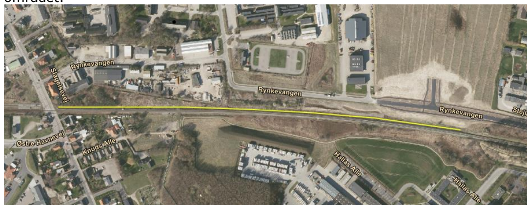
Figur 2.3.: Banegrøftens forløb

Banegrøften har således tilløb fra spildevandstekniske anlæg og tilleder til et spildevandsteknisk anlæg – og vil i fremtiden modtage mere overfladevand fra området.