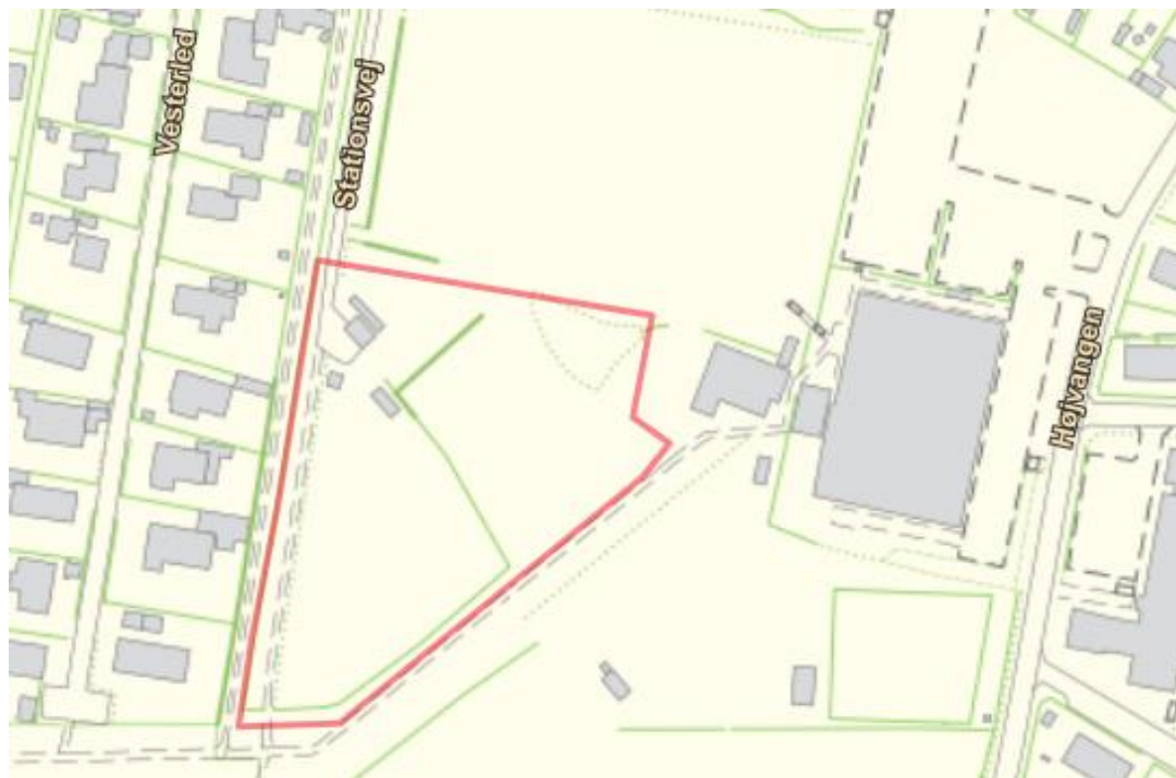
Figur 2.2.: Oversigt over området

Hvis det ønskes at regnvandet skal nedsives, kan dette etableres, hvis det af en autoriseret kloakmester eller anden konsulentvirksomhed kan godtgøres, at dette er muligt og ikke skaber gener for omboende. Herved kan tilslutningsbidraget reduceres.