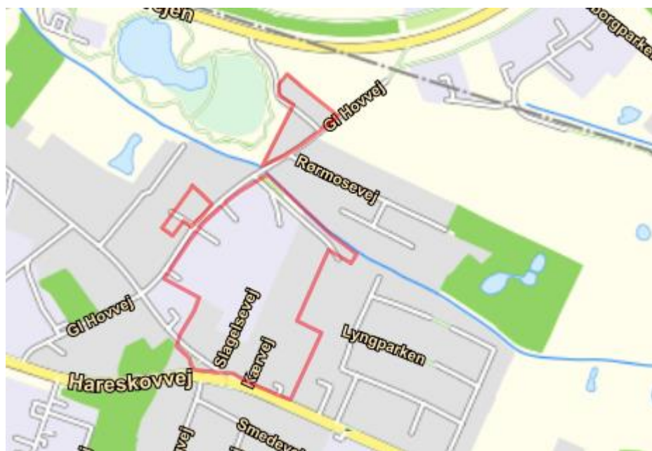
Figur 2.1.: Oversigt over områderne

De pågældende lodsejere orienteres direkte via E-boks eller post hvis de er undtaget for E-boks.