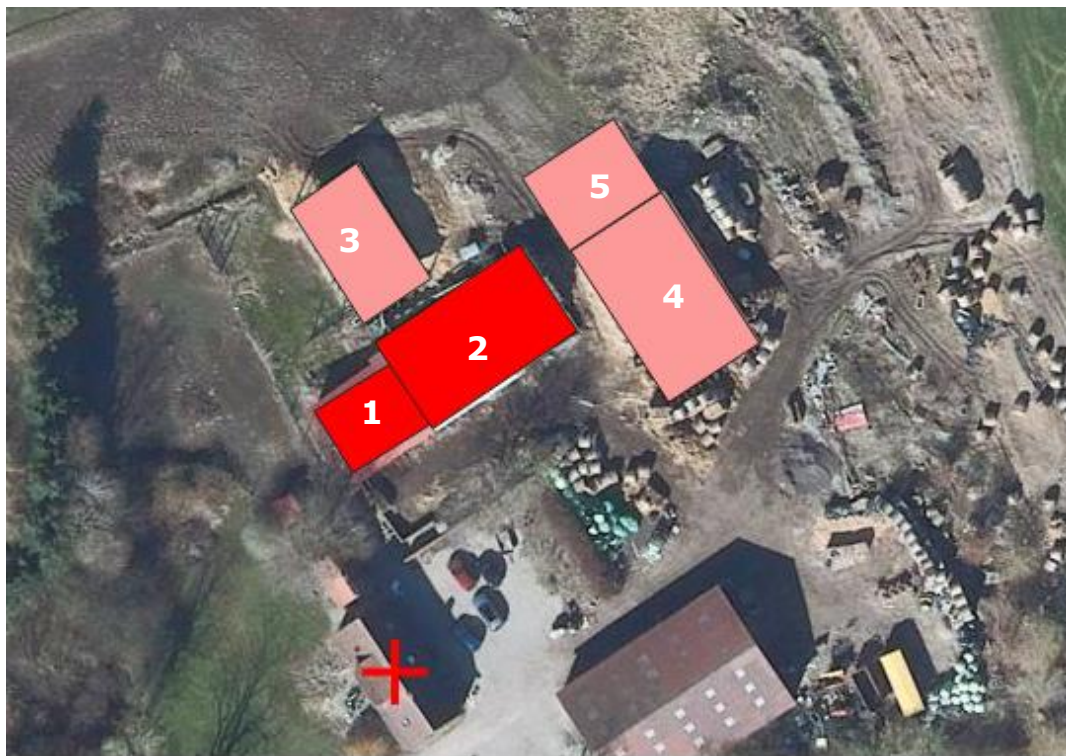
Figur 2: Ejendommens produktionsarealer. Eksisterende tilladte stalde er markeret med rød og ny-tilladte stalde er lyserød.

Husdyrbruglovens kapitel 2 oplister en række afstandskrav. Kravene gælder for nyetableringer og ændringer, der medfører forøget forurening.