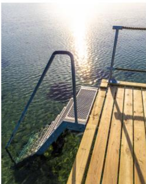
Figur 4 – Eksempel på lignende bro.