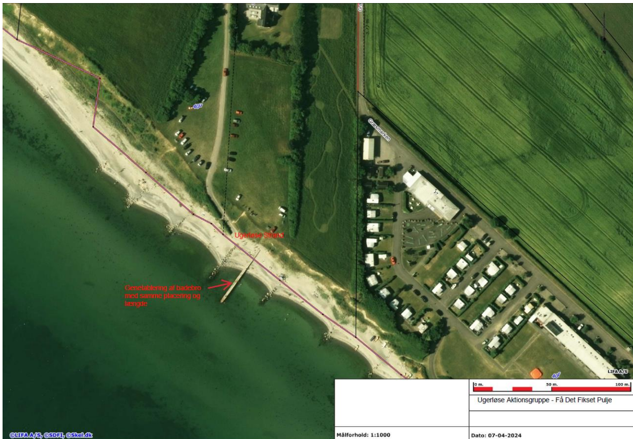
Figur 1 - Oversigtskort over Ugerløse Strand med angivelse af den ansøgte bros placering. Broen erstatter en tidligere, offentlig badebro med nogenlunde samme omfang og placering.