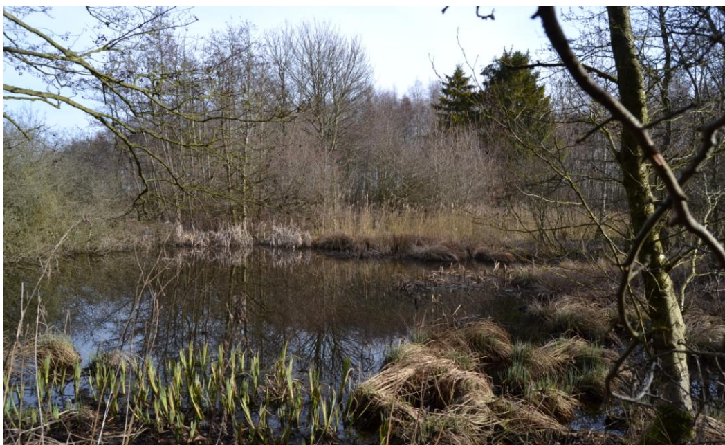
Søen tidligt forår.

Vi har igennem 2 år jævnligt besøgt området og har kortlagt især floraen, men vi har også registreret, hvad der er observeret af fugle, andre dyr og insekter. Alt dette er listet op bagest i denne lille rapport, et sp. efter en art betyder, at arten ikke er nærmere bestemt. Trods alle disse besøg kan flere arter være overset, og der er sikkert nogle planter, dyr og insekter, vi ikke har mødt endnu. Der vil også gennem årene ske en ændring i sammensætningen af både plante- og dyrebstanden, naturen veksler hele tiden, noget forsvinder, og nyt kommer til. Således var der tidligere Gøgeurter i kanten af mosen, disse er siden forsvundet på grund af tilgroning. Men hvis man rydder lidt buske og træer her, kan de måske dukke op igen.