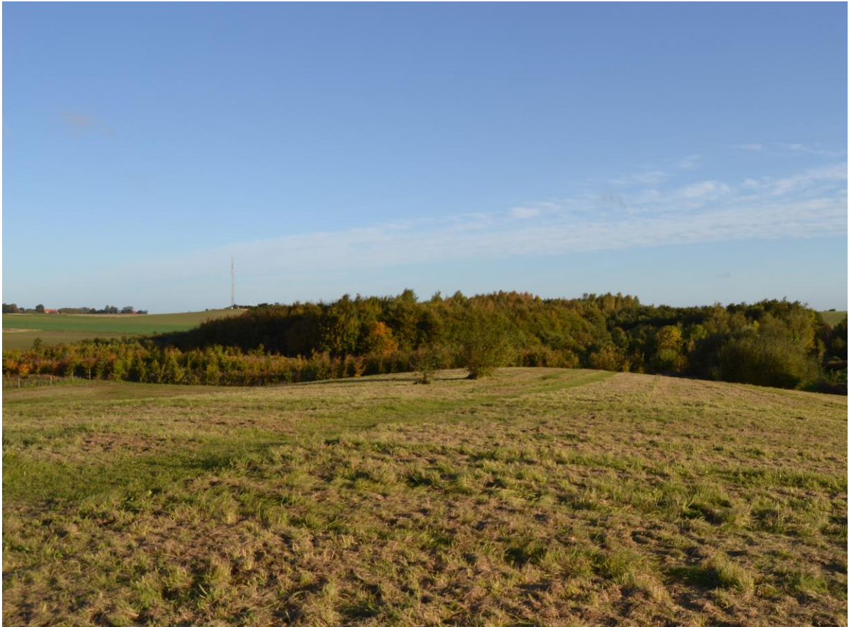
Skoven set fra Gåsebjerg.