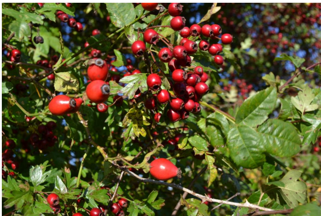
Hyben fra Glat Hunde-Rose og de mindre bær fra Hvidtjørn.

Der er registreret næsten 60 forskellige buske- og træarter. Rigtig mange af disse er ikke egentlig hjemmehørende i det, vi opfatter som skov. Det drejer sig f. eks. om træer som Skyrækker, Guldhængepil, Ærtetræ m.fl. Buske som Forsythia, Dronningebusk og Rhododendron er jo heller ikke lige det, man forventer at finde i en skov, men det gør kun oplevelsen så meget større, når man går rundt i området.