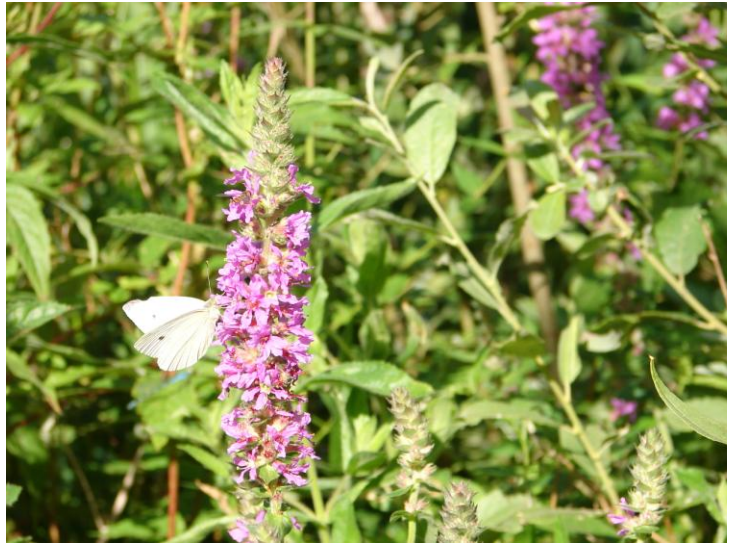
Tv. Kål-Tidsel. Kålsommerfugl på Kattehale.