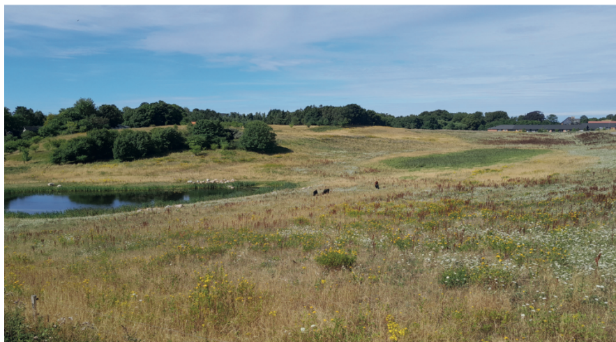
Foto viser: Naturområdet syd for Herredsåsen , Kalundborg med overdrev, en ny sø og vådområde, set mod vest

Foto side 22: Forslag til skabelse af mere god natur!