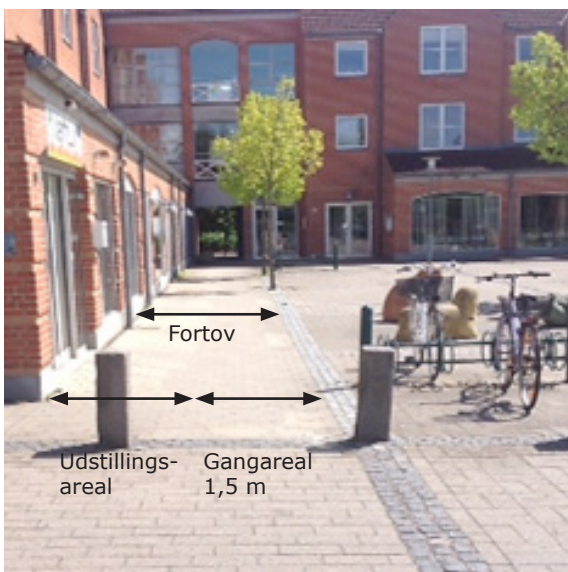
På torve og pladser kan der være mange ganglinjer. Der skal som minimum være et frit gangareal langs facaderne. (Eksempel fra Bytorvet i Gørlev)