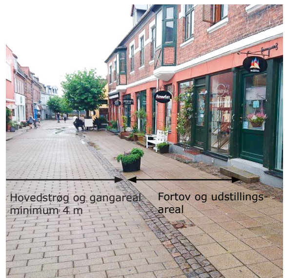
I Skibbrogade må arealet langs facaderne bruges til udstillingsareal. Hovedstrøget i gaden midte bruges til gående og anden tilladt færdsel.