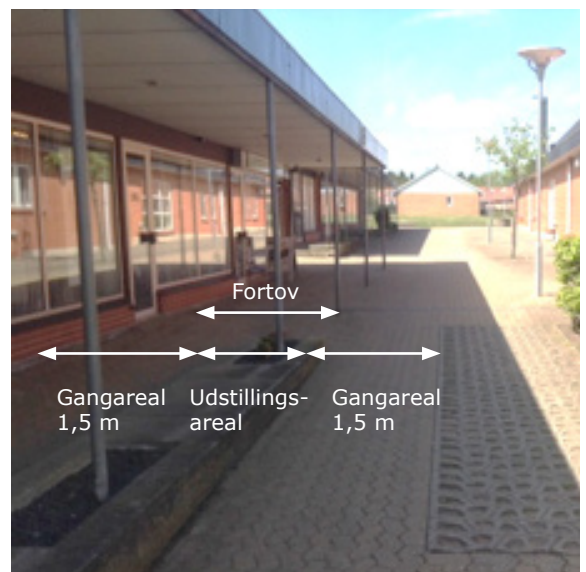
Er det ikke entydigt, hvordan ganglinier og udstillingsareal placeres, må man tænke over, hvordan en person med funktionsnedsættelse bedst kan færdes uhindret. (Eksempel fra Centret i Svebølle)