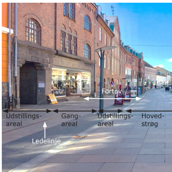
I Lindegade, Kordilgade, Øen og Vænget skal gangarealet omkring ledelinjerne holdes fri.