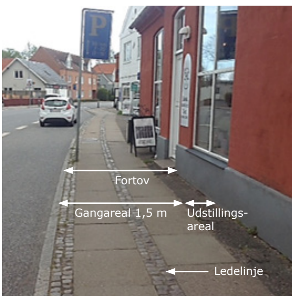
Når fortovet er belagt med fortovsfliser opdelt af chaussésten, fungerer rækken af chaussésten som en ledelinje, som gangarealet centrerer omkring. (Eksempel fra Hovedgaden i Høng)